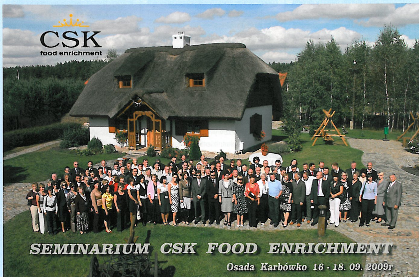
SEMINARIUM CSK FOOD ENRICHMENT Osada Karbówko 16 - 18. 09. 2009r